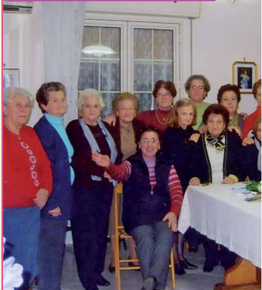
GRUPPO DI PREGHIERA DI BAGHERIA - PA

Se sei una persona attaccata ai programmi televisivi, mortificati, e la tua sofferenza voluta da te, ti purificherà dal tuo difetto e sarai sulla strada della penitenza. Gesù, nel silenzio ti farà gustare il suo amore e tu gli par-